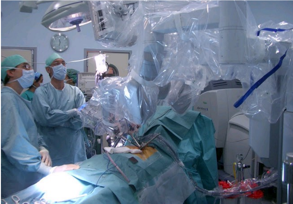
CIRUGÍA ROBÓTICA EN EL HOSPITAL CARLOS HAYA DE MÁLAGA( ESPAÑA)