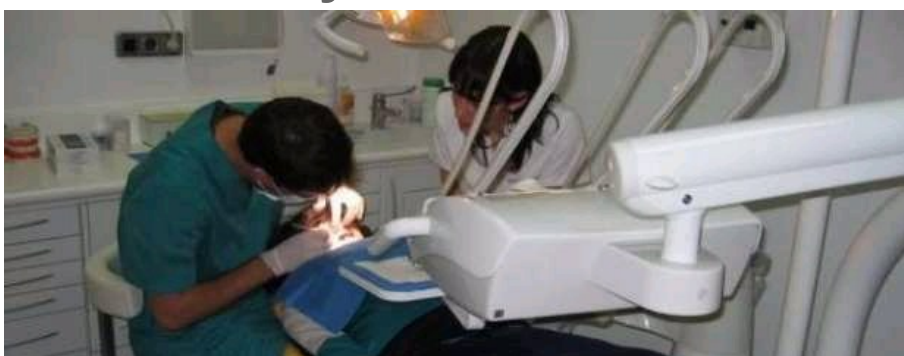
Imagen de archivo de un dentista.