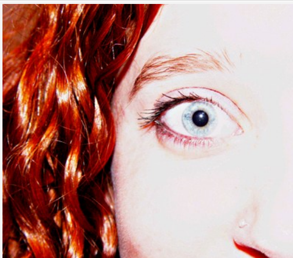
El color rojizo del pelo predispone a tener más dolor

Una de cada cuatro personas tiene miedo al dentista, lo que ocasiona una pobre salud oral, según una revisión de estudios de la plataforma Miedoaldolor.com, en la que colaboran especialistas en dolor, odontología y psicología y en la que participa la Sociedad Española para el Estudio de la Ansiedad y el Estrés (SEAS) . Factores hereditarios , como tener el pelo rojizo , y psicológicos, como que el padre tenga miedo, predisponen a padecerlo, y el uso de la realidad virtual ayuda a