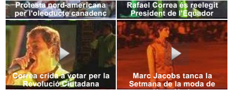
Powered by zoomin.tv (2013)