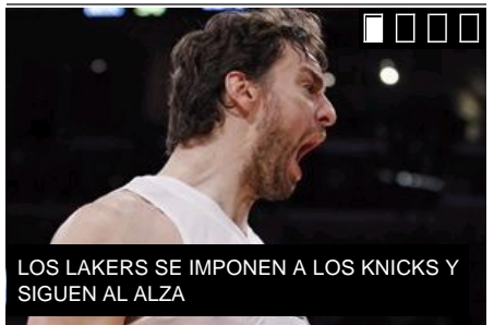
LOS LAKERS SE IMPONEN A LOS KNICKS Y SIGUEN AL ALZA

SUSCRÍBETE A LAS NOTICIAS DE SALUD EN TU ENTORNO: